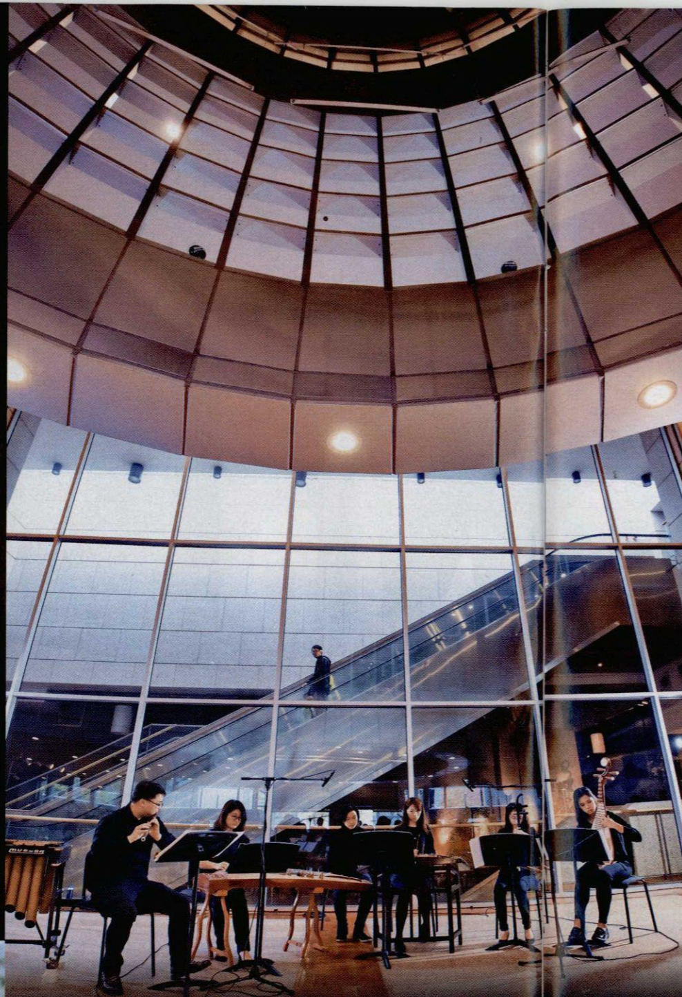
▲除了西洋音樂，香港浸會大學音樂系中國音樂小組，亦以傳統中樂再現絲路傳奇，樂音悅耳悠揚，觸發大家想像。

絲路文化音樂演奏——「浩邁之旅」音樂接觸系列 日期：2月10日（星期六） 時間：中午12時至下午1時 地點：香港歷史博物館專題展覽廳 參加者須持「絲互萬里——世界遺產絲綢之路」展覽當天有效門票 日期：2月25日（星期日） 時間：下午3時至4時 地點：香港歷史博物館大堂 免費入場