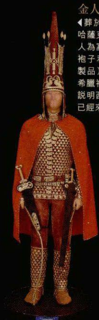
金人 ▲葬於公元前四世紀的哈薩克斯坦伊塞克基主人為塞人酋長，所穿的袍子和所戴的金飾(複製品)上都飾有啟發自希臘神話文化的圖案，說明西方與東方在古代已經來往頻繁。