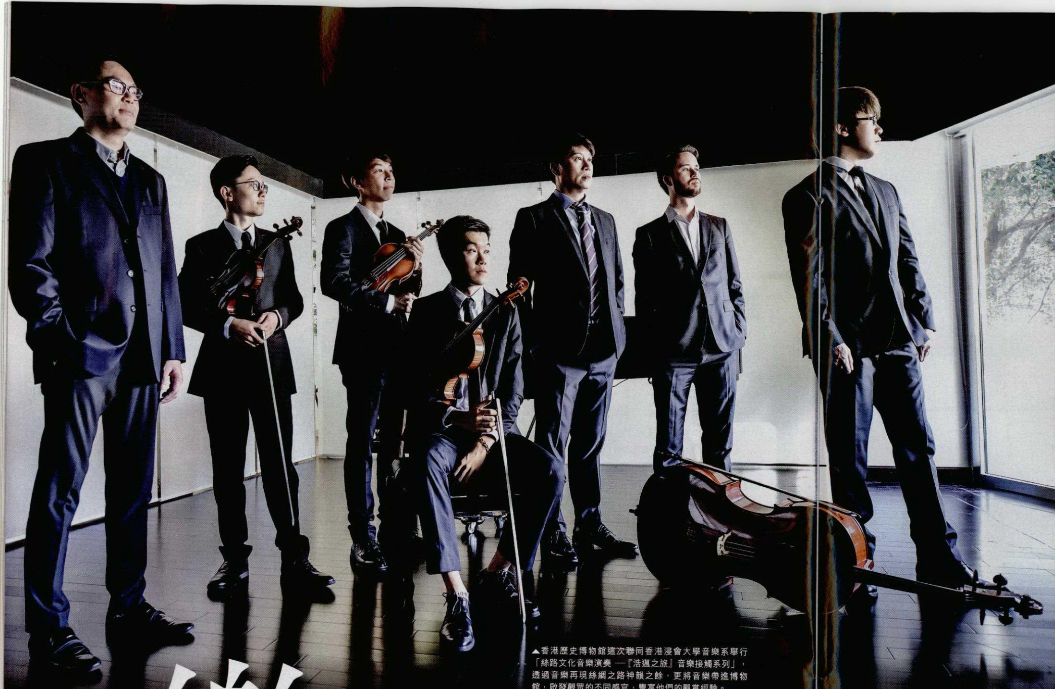
▲香港歷史博物館這次聯同香港浸會大學音樂系舉行「絲路文化音樂演奏——「浩蕩之旅」音樂接觸系列」，透過音樂再現絲綢之路神韻之餘，更將音樂帶進博物館，啟發觀眾的不同感官，豐富他們的觀賞經驗。