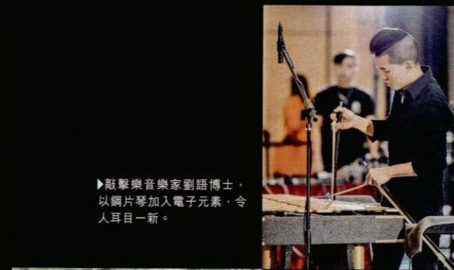
▶敲擊樂音樂家劉語博士，以鋼片琴加入電子元素，令人耳目一新。

絲路文化音樂演奏——「浩邁之旅」音樂接觸系列 日期：2月10日（星期六） 時間：中午12時至下午1時 地點：香港歷史博物館專題展覽廳 參加者須持「絲互萬里——世界遺產絲綢之路」展覽當天有效門票 日期：2月25日（星期日） 時間：下午3時至4時 地點：香港歷史博物館大堂 免費入場