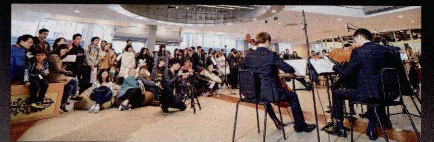
▲香港歷史博物館首度與香港浸會大學音樂系合作，為展覽籌辦音樂會，給觀眾帶來驚喜體驗。

「絲互萬里——世界遺產絲綢之路」展覽 日期：即日起至3月5日 開放時間：平日上午10時至下午6時 周末及公眾假期 上午10時至晚上7時 地點：香港歷史博物館（九龍尖沙咀漆咸道南100號） 入場費：標準票20元、團體票14元、優惠票10元 博物館通行證持有人免費入場 查詢：2724 9042 網址： http://hk.history.museum