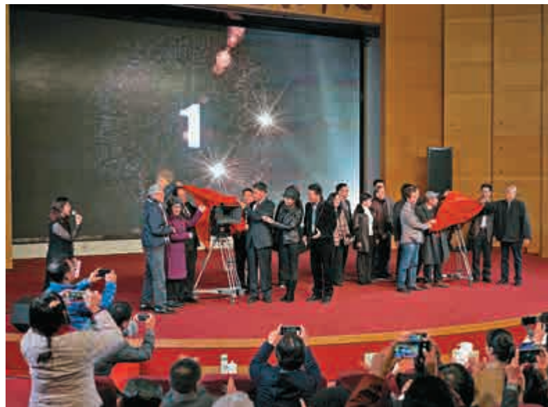
▲《一代天嬌——紅線女》在廣州舉行開機儀式