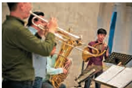
▲Mr. Brass銅管五重奏呈現多首流行音樂