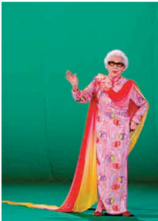
▶紅線女的表演藝術，和中華民族歷史長河、民族復興緊密相關

【大公報訊】記者黃寶儀廣州報道：為了表彰紅線女對粵劇事業的卓越貢獻，振興繁榮廣州粵劇藝術事業，大型紀錄片《一代天嬌——紅線女》將打造成第一部用十集篇幅展示以紅線女為代表的粵劇事業起伏浪潮的紀錄片，其啟動活動本月十三日在紅線女藝術中心舉行，同期拍攝的同名紀錄電影則計劃於二〇二〇年在影院上映。