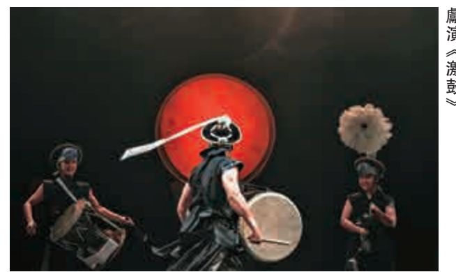
▲來自韓國的踢高鼓樂團本月末獻演《激鼓》

他續稱，《一代天嬌——紅線女》還將沿着紅線女人生的歷程，走訪加拿大、新加坡、馬來西亞、俄羅斯、香港、澳門等國家和地區，配以珍貴的日記、隨筆和採訪記錄等，讓人們看到一個真實的傑出生命如何在大時代的風雲中，與粵劇藝術融為一體，走向永恆的過程。